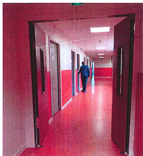
Porte coupe-feu de recouvrement (couloir)